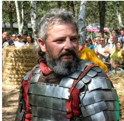
Рыцарь без страха и упрека

Среди таганрогских металлургов оказалось много любителей экзотики, истории, рыцарских поединков, поэтому такой фестиваль они пропустить никак не могли – приехали семьями и с друзьями.