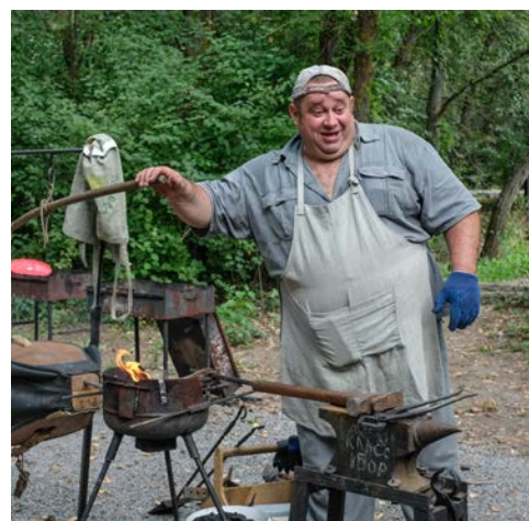
Кузнечных дел мастер

Откуда у него появилось увлечение стариной никто из опрошенных нами участников фестиваля объяснить не смог: ни реконструктор, ни рыцарь, ни простой поклонник Средневековья. Все сошлось в одном – это образ жизни.