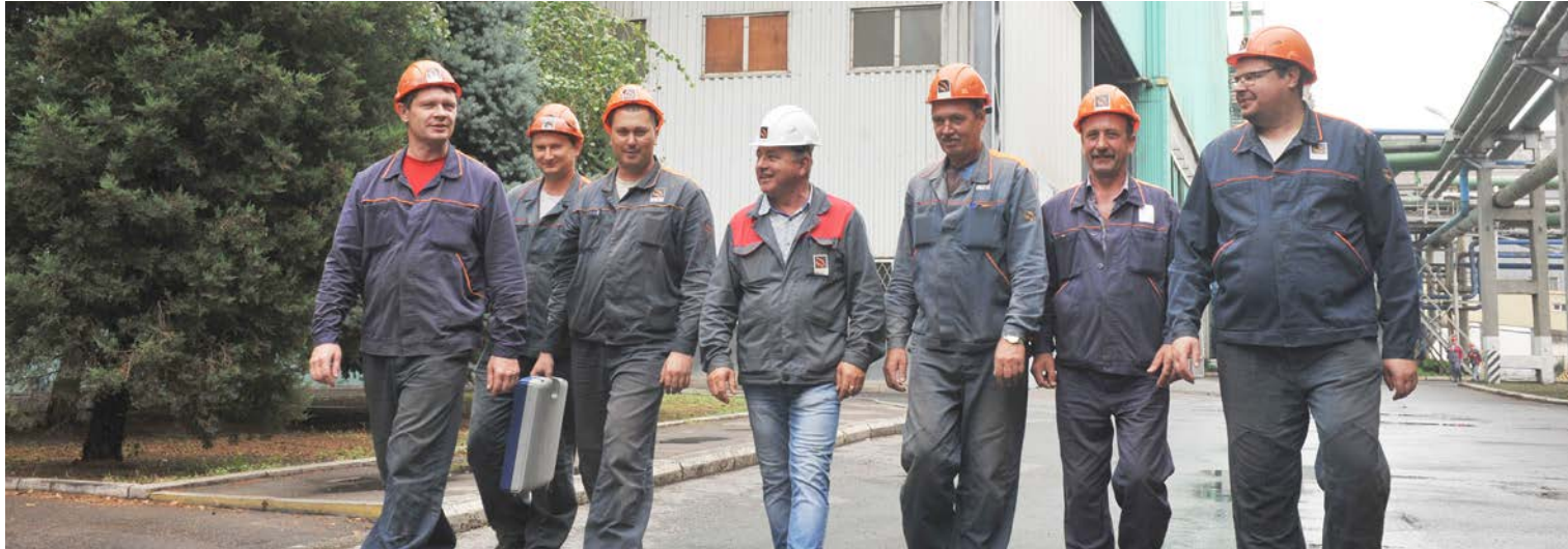
Специалисты участка по обслуживанию сетей и подстанций

стр. 1 На ТАГМЕТе впервые силами заводских энергетиков произведена замена проходных изоляторов. Это оборудование на предприятии используется для подключения вводов подстанций, от которых запитаны производственные цехи и подразделения.