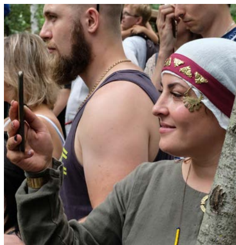
Участница фестиваля в историческом костюме