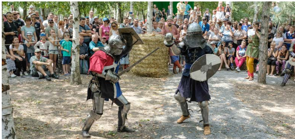
Поединок средневековых воинов

В минувшие выходные в селе Покровское, на территории парка «Санрайз» прошел фестиваль Средневековья «Время мечей».